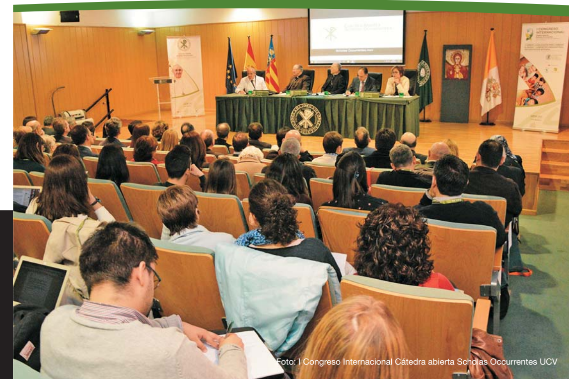
Foto: I Congreso Internacional Cátedra abierta Scholas Occurrentes UCV